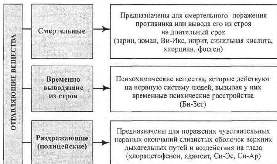
Схема 2. Классификация отравляющих веществ в зависимости от характера поражающего действия

газы и смеси состоят из относительно безвредных компонентов, дающих при смешивании высокотоксичные ОВ. Принцип действия бинарных ОВ состоит в том, что во время выстрела разрушается перегородка между двумя нетоксичными компонентами, в результате чего происходит химическая реакция.